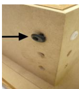
element wkładamy wkręty i wkręcamy je,